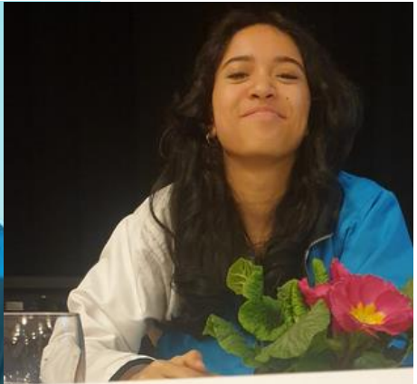
Mira Saiful Ressort Jugend